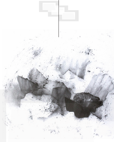
Géologies immuables © Delphine Deshayes