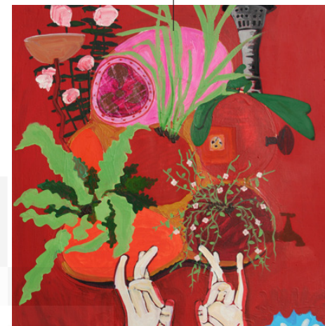
Fiction 5, 2016